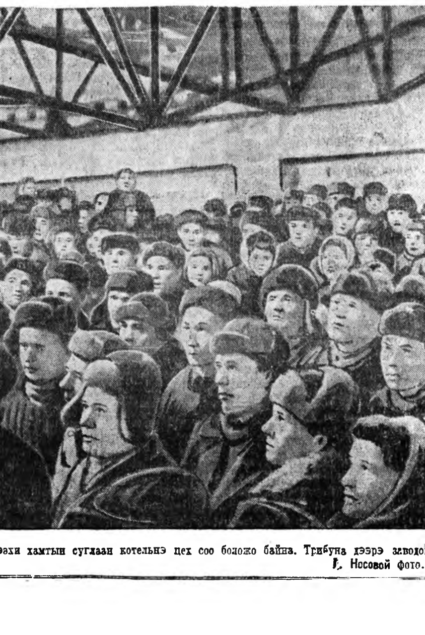
Улан-Удын Ленинэй орденто паровозо-вагонно заводой хүдэлмэришэдэй, инженерүүдэй, технигүүдэй ба аҗбахаагшад хамтын суглаан котельня цех соо боложо байна.

Тус суглаан хадаа арадуудай гениальна вожь нүхэр Сталинда, большевигүүдэй агууехэ партида советскэ хүнүүдэй үнэн сэхэ ба инаг дуратай байдаг хүсэтэ демонстраци болоо.