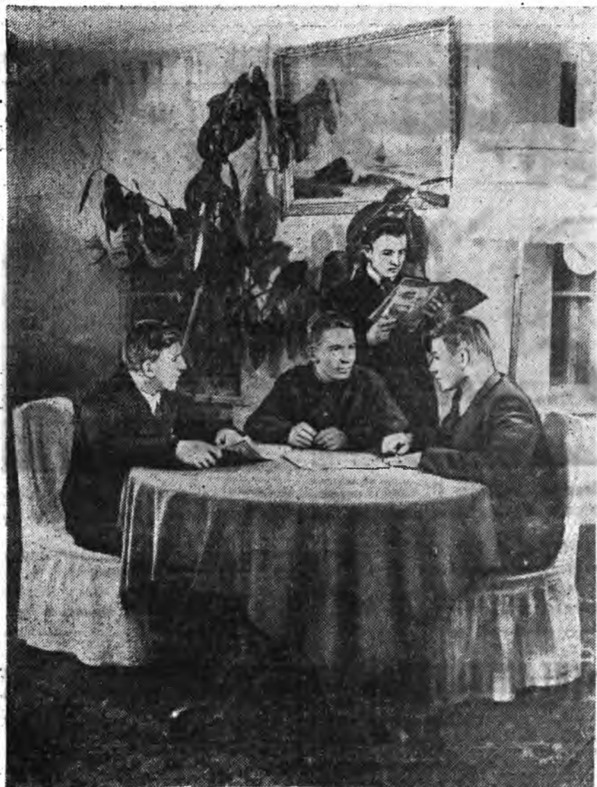
Челябинска областёго гэр байрыг—культурна эмхи заргаануудай барилгала ехэ мүнган табидала.

Жаргалай ехэ жаргалтай, Жара гарамгай нахатай Эжынэ Доржидо харатгаад, Энэбхилдэ уриханаар.