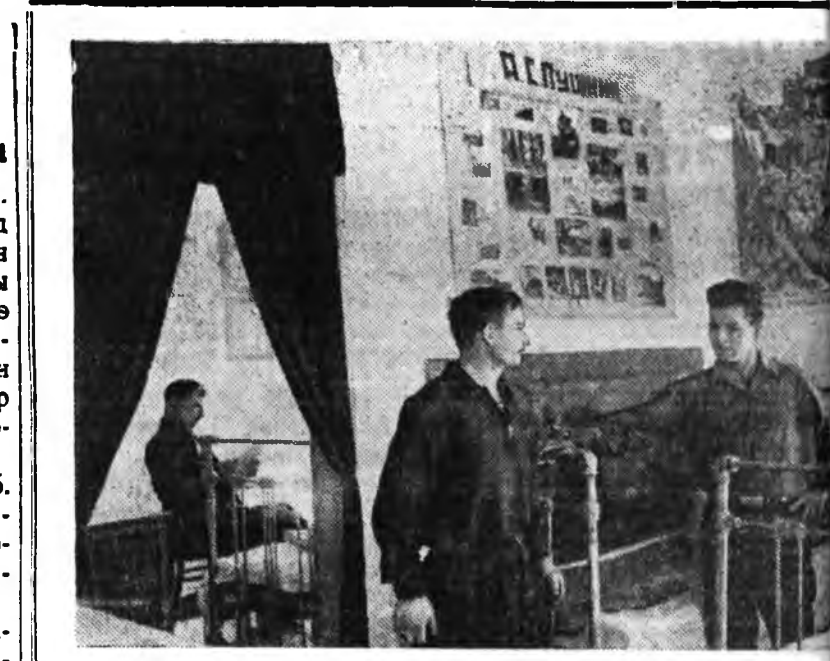
Краснодарска хизаар. Советскэ районной Ворошиловай нэрэмжэтэ полинууд дээрэ хүдэлмэрлэдгэ Советска МТС-эй трактористнуудта түхэтэй, харуул һайн хамтын байра барилгал. Зураг дээрэ: тракторист дини полевоы стандахы хамтын байрыг нэгэн таһалта соо.

ШАНХАЙ, февралын 23. (ТАСС). Токноһоо мэдэвэлсэһэнэй ёһоор, үнгэрһэн жэлэй декабрийн эсэстэ Иосидатай хэһэн зүблөөн дээрэ Макартур болбол Японини компартийн хуулиһаа гадуур гэжэ сонсохохо тухай асуудал табиһан байгаа. Гэхэтэй хамта, Макартур Японидохи антиамериканска этэгдүүлхыг хичаха хиналта шангалдаха ба главна юридическэ управлений мурдэлһын тусхай бюоренууса тусхай полици болгохо гэнэн заабарине Иосидада үгтэнэ байгаа.