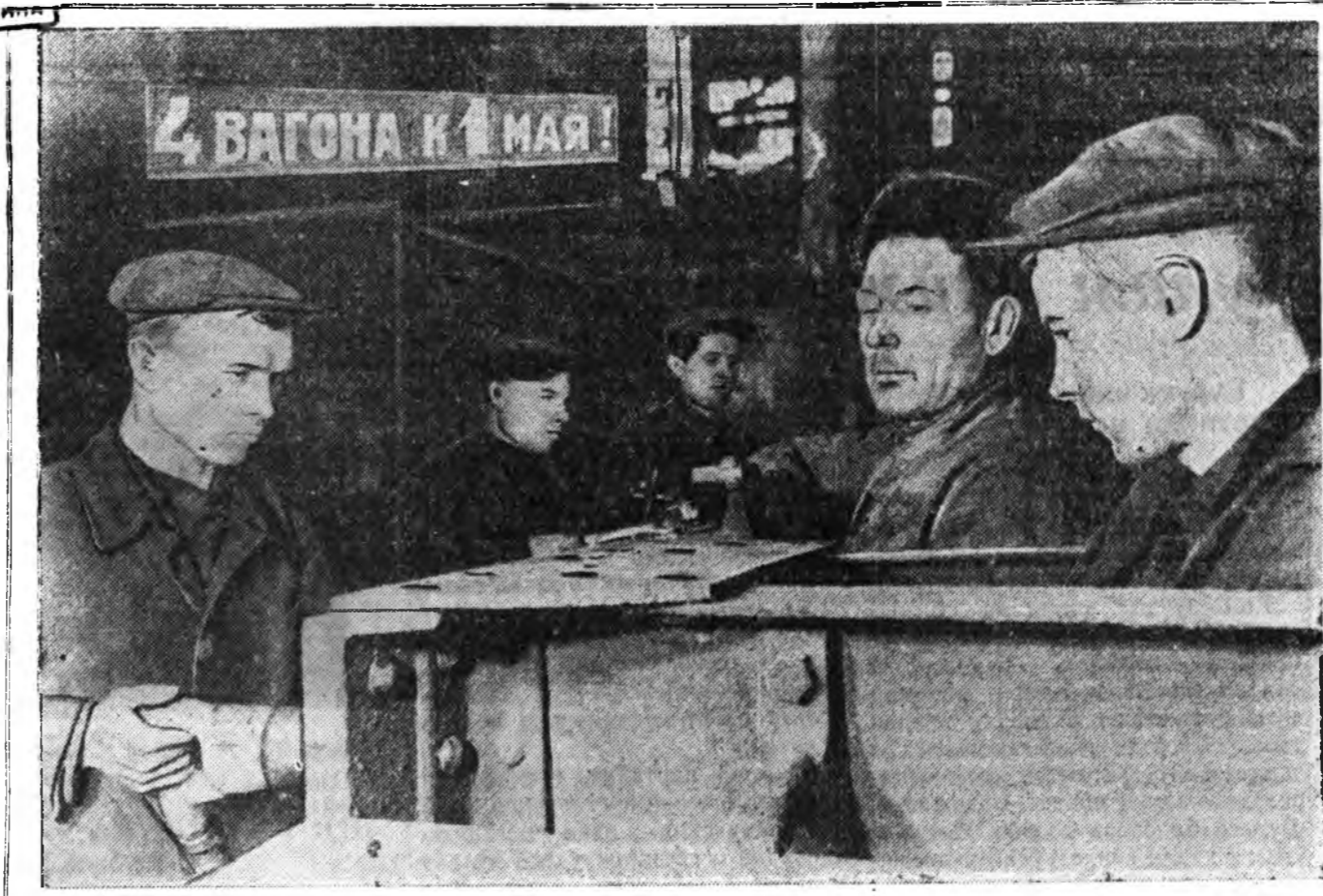
Ленинэй орденто ПВЗ-гэй парово- зо-вагонно цехын коллектив Майн урда тээхи социалистическэ мүр- сөөндэ ороходо апрелингээ түсэб болзорһоон ури дүүргэхэ, нарын- гаа түсэбһөө гадуур 4 вагон бү- тээн гаргаха уялга абанхай.

ажалшаддай дайшалхы хүсые ха- раха үдэр, «Хабарай тарилгын үдэ колхозно парторганизациин ябуулха нинтэ-политическэ хүдэл- мэри» гэхэн материалнууд тол- лодоо. Мүн 1951 оной апрель, май нарануудта үнгэргэдхэ хөөр- лөөнүүдэй темэ, түсэб ба лите- ратура тэвэ заагдахай.