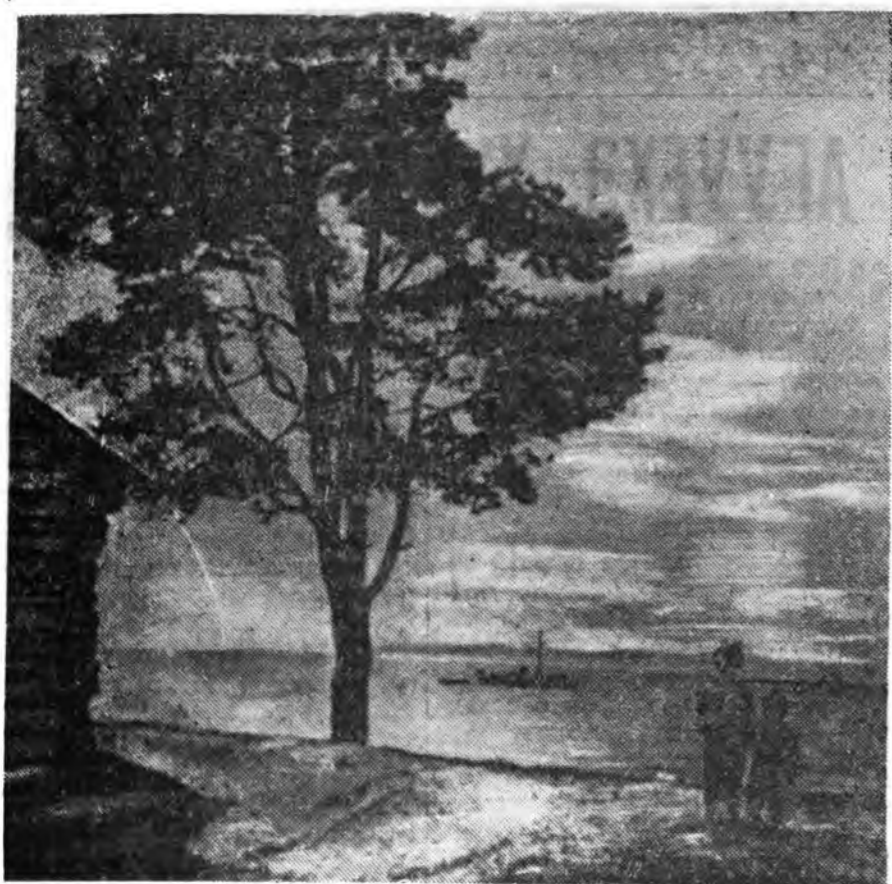
БАЙГАЛАШ ЭРБЕД.