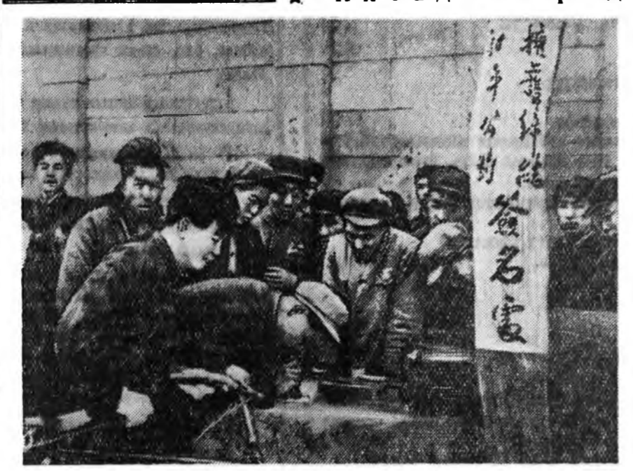
Агууехэ табан гүрэнүүдэй хоорондо Эб найрамдалай Пакт баталуулха тухай Эб найрамдалай Бүхэдэлхэйн Советдэй Хандалгада гар табяулха кампани ехэ дэмжэлтэйтэйгээр дэлгэржэ байна. Тяньцзинь городой хүн зоний 70 үлүү-тэй процентн тус Хандалгада гараа табяа. ЗУРАГ ДЭЭРЭ: Тяньцзинь улаануудуудар Эб найрамдалай Бүхэдэлхэйн Советдэй Хандалгада гар табяага байна.