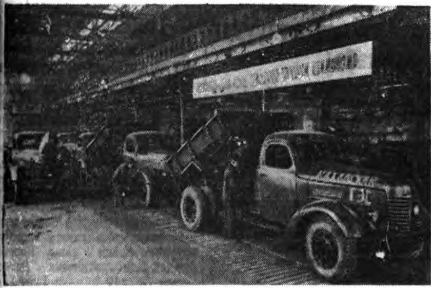
Днепропетровск автомобильна завод дэйнэй хойто тэхи табанжал соо баригдаа юм. Заводой коллектив коммунизмын асари ехэ барилгатуудай захилнууцын нэрэтэй түрэтэйгөөр дүүргэе. Мүнөө тус коллектив самосвалнууды Каховско ГЭС-эй баригтада эльгээхээр бэлдэжэ байна. ЗУРАГ ДЭЭРЭ: самосвалнууды холболгын главна конвейер харуулагдана.