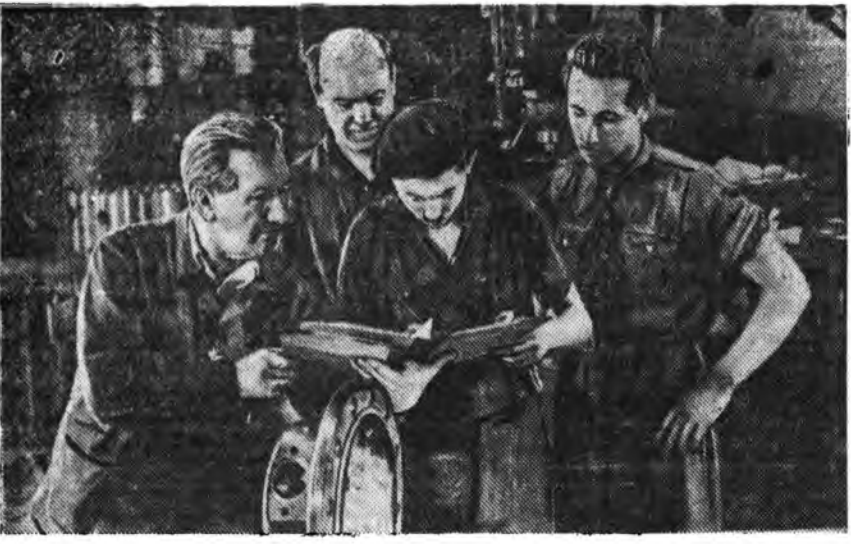
Венгерск арад эб найрамдал эрид шууд хамгаалжа байганаа харуула. Агууех табан державануудай хоорондо эб найрамдалай Пакт баталуула тухай Эб Найрамдалай Бүхэдэлхэйн Сөвөдэй Хандалгада гар табуулжа кампани эндо эхэ амжалтагайгаар үнгэрэгжэ байна. Венгрийн гороудууд ба тосхонуудай хүн зон Хандалгаа угаа эхэ байрагтайгаар гараа тайна.