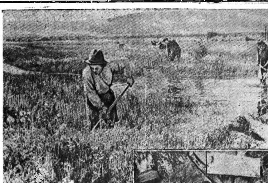
Поволгын аймагай Сталиной нэрэмжэтэ колхозой тэжээл бэлэдхэлэй бригада энэ хабар сабшалангай ба башшэрини газар найжаруулаа ехэ хүдэлмэри хөһөн байна.

Тус бригадын гшүүд арбан жэлэй турша соо ашаглагдаагүй байһан уһалуурин ханава хольбон заһабарилжа, энэ сетһнэ хабартаа ба зундаа ехэ талмай уһалаа. Тинхэлэ 50 гектар намаг газар хантаһан ба 450 гектар газарай модо шулуу сэбэрлэнэ байна. Сабшалангайгаа газар харууһалжа байһын тула дүй дүршэл хэтэй 10 хүнийе томолоо, 800 гектар газар найрамай уһаар, 500 гектар газар уһалуурин сетһнэ уһалагдаһан байна.