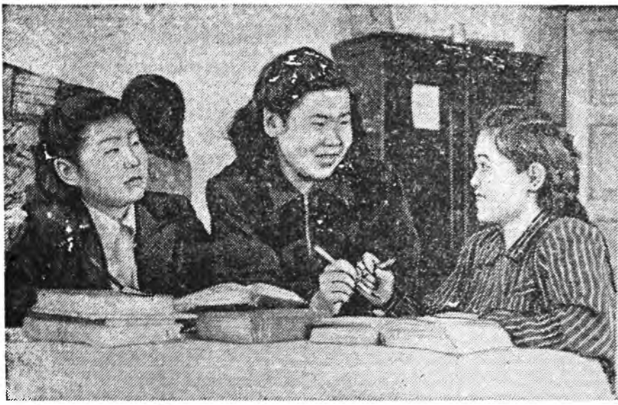
Улан-Удын педагогическа училищи мэргэжэлтэй залуу багшанары бэлэдхэнэ. Мүнөө нуралсадай шэнэ жэлдэ олон хубууд, басагад агтаад, бурят-монгол отделинид 3 класс, нургуулин, дошкельно ба багшанар-ахлагтна пионервожатануудай нэжээд класс эмхидхэгдэнхэй.