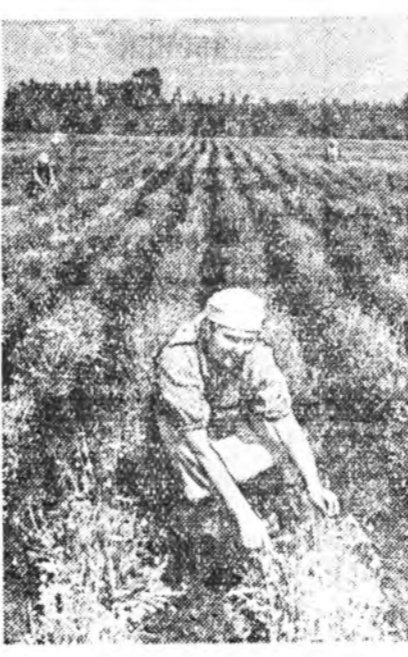
Белорусска ССР. Вобруйска өлэстийн Стародорожско району Сталинэй нармажэтэ колхозо кук-сагызай үр-һанууды ехаар сугауула.

Город нэгэ нэгэ гэрээр бэшэ, харин бүхэй квартал баригдана. Мүнөө нэгэн доро б кварталуудта гэрнүүд баригдана. Баруун урда хубидан гэр байрын хоёр квартал баригдаха дүүрэхэ байна.