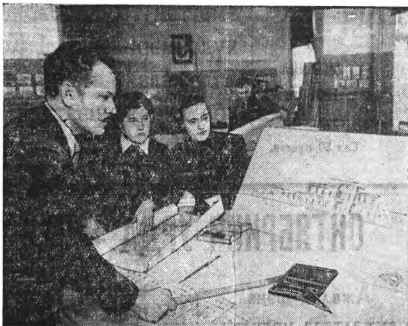
Одесса инженерно-барилгын институтай түдөө ажахын машина бүтээгч факультетыд тургуулан дүүргэгшэд Украинаны колхозуудта ба манай орой бусад республиканыуудта барилга дээрэ хүдэлмэрилхөөр томлодог.

Кружогтой, полтигургуулийн заняти нэгшье удаа таһалдуулжа болохотой. Пропагандаистнууд халаа занятинуудтаа найнаар бэлдхэжэ, занятига удаа хайнтайгаар ба ойлгосотой тодоор үнгэргэхэ ёһотой. Марксизм-ленинизмын үндэһэ хууринуудые шудалха зуураа, коммунистууд халаа юрэнхы эрдэмдэ дээшэлүүлжэ, ураннайханай литература уншаха, түүхын музей, кино, театр ошожо харадаг байха зэргэтэй. Партинын кабинетүүд болбол бээ дагаад шудалагшадта ходоодо туһаламжа үзүүлжэ, марксизм-ленинизмын классикуудай зохёолнууд тухай лекцинуудые эмхидхэжэ байха зэргэтэй.