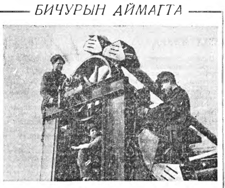
Бичурын сахарый завод хэлбэргдэн захбарлагдана, тэнэ хэвнэ корпуу пнээр баригдаа. Мүнөө үедэ заводой түхээрэггануудыг байрануудтаа тохихе хүдэлмэри хэгдэжэ байна. Энэ хүдэлмэриг нүхэр Панаовый бригада хүн шэжэ харуулжа, үдэр бүррингөө аалгабарн 250—275 процент дүүргэнэ.

Гэбэшье, нимэ хэдэлгэнүүд огто үндэһэгүй байна. Норвегидхи советскэ сэргэшэдэй клалбшануудай ба могилауудай олонхын хүн зунуудта ба хүн зонтой нютагуудай дэргэдэ байһаниинь мэдээжэ. Усадхагдахын урда тээ эдэ клалбшануудай олонхи хубын нилээд байһан байдалда байһан юм, тинмэнээ тэдэниие ямар нэгэи ондоо газарнуудта абаашаха огто хэбэргэй байгаа. Энээн тушаа советскэ Посольство Норвежскэ Правительствын анхаралыг нэгэтэбэшэ хандуулан байна. Гэбэшье, Норвежскэ Правительствоо эдэ могилауудыг олоор усадхаба, хүн зоноор үсөөн, холын райондо байдаг Тьетта арал дээр советскэ сэргээгүдэй хүүрнүүдэй уридуулан абаашахыг хараална. Тьетта арал хадаа урдан советскэ сэргэшэдэй хүүрнүүдэй хүлөөлүүлхэн олонхи газарнуудта ороходо, хүн зоной ошохоор нилээд таарамжатай газар байһан хэбэртэйгээр баталхыг Норвежскэ Правительстводо нэздэнэ. Гэбэшье, тинмэ баталагда ямаршье үндэһэгүй Анханда хүлөөлгдэнэ газарнуудтаа олон зуугаар километрын хараанда байдаг Тьетта арал дээрхи клалбшануудта ошохоно, материк дээрэ байһан клалбшануудта хүн зоной ошохо гэһэн нилээд хүнгэн бидэһэнэнь тон толдорхой байна.