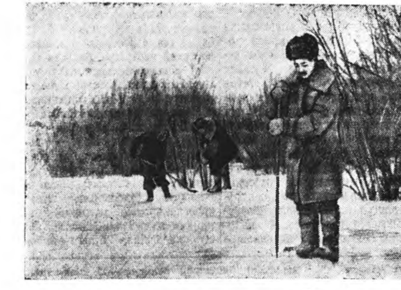
Сабшалан дээрэ наг шэбхэ шэрэжэ байна.