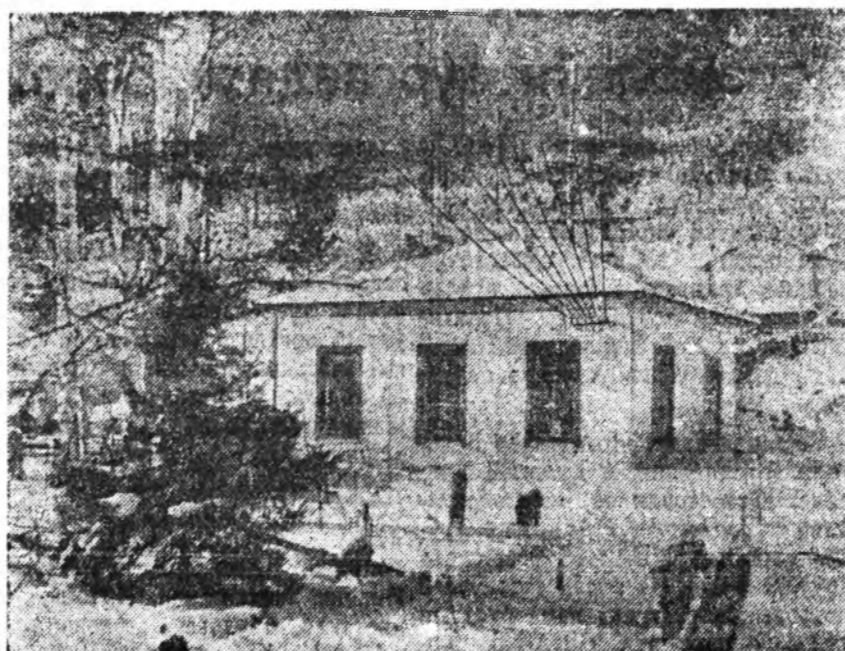
Сагайны аймагай Тельманай нэрэмжэтэ колхоздо шэнэ гидроэлектростанци баригтаал, ашталгалда оруулагта. Колхозноо 15 километрин газарта Убукун гэжэ түргэн уралхалтай голэй эригдэх гой байхан газарта энэ электростанци баригтаал.