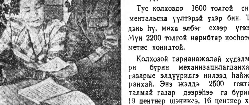
Хониды дулаан байраар хангаха гэжэ эхэ ухашанартай. Нэгэ бүдүүн хониндо 1,5 кубометр, түлднэ—0,6—0,8 кубометр талмай хэрэгтэй юм.

Колхозой тарянажалал хүдэлмэри бүрин механизацилгданхай, газары элдүүлгэһэн нилээд һайжаранхай. Энэ жэлдэ 2500 гектар талмай газар дээрһээ га бүрин 19 центнер шэниснэ, 16 центнер хара тарьян ба овёс абтаа.