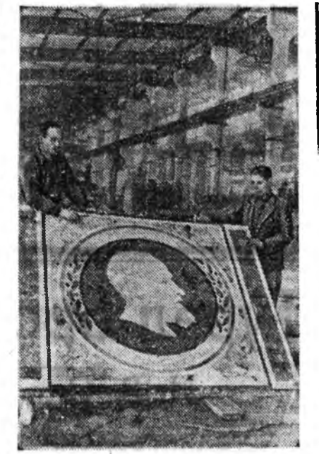
Московно область. Шудуу болбооруулаг завод Ленинскэ хаданууд дээрхи гурэнэй Московско университетэдэй барилгада 60 мозачна портрэдүүдэе бэлдэхэ, тэжэн нарын Ордоной залнууды шэмэглэхэ юм.

Главна Туркменскэ каналай гол барилганыуд энэ жэлдэ барилгада эхилхэнэ. Эсэгэ оронойгоо хүсэн түгэлдэр техникые — газар малга-