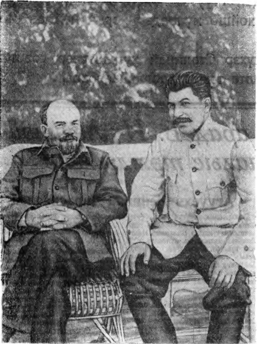
В. И. Ленин, И. В. Сталин Горкодо. 1922 он.