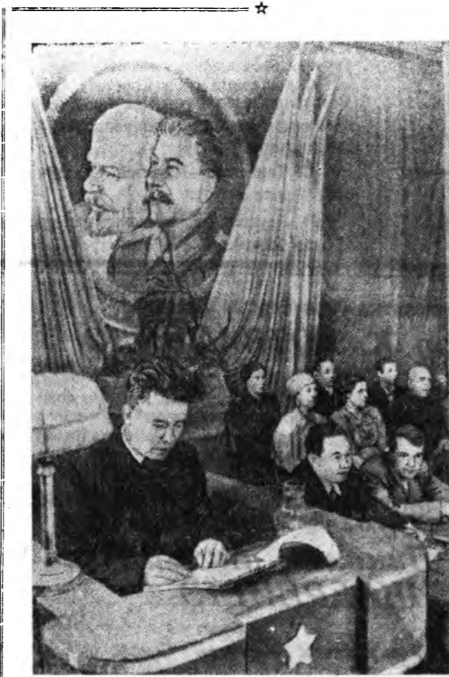
1952 оной 1-дэхин кварталда дэлгэрһэн социалистическэ мурсыөөнэй дүнгөөр Улан-Улсын шалыг механизировайна завод Бухасоюана хоёрхой шанда хүргэһэн байна. Энэнтэй дашарамжуулан заводой коллективэй суглаан болоо.