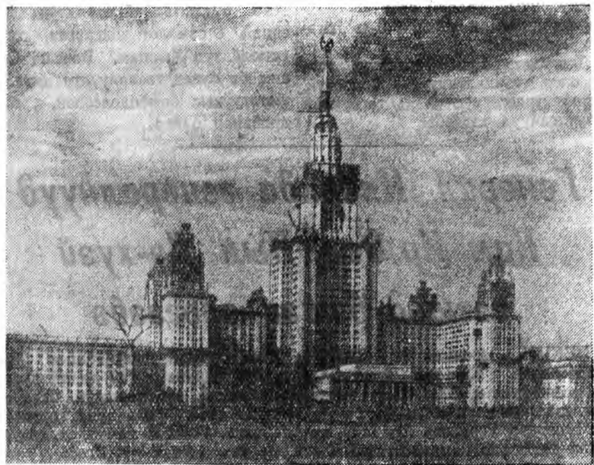
МОСКВА. Ленинскэ хадануудтай Московскэ гүрэнэй университетэй

Студентууд комнатууд зайлалда, библио-текада гу, али контордэ ошоходо үдүү сүдэ гээхэй байна. Юб гэхэдэ, байшангай досоогуур центрайна дээрэ үй-дэртэ гараха, агаар зал, күбэ ба спор-тивна зал ошохо сэхэ замуд бай.