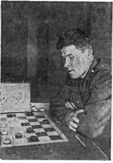
Москва. Даам наадалгаар колхозпигуудай Бүтөөсөөнэ мурьсөөнүүд эндэ болоһон байна.