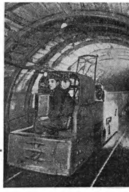
Сталинин област. Донбассе

Муниципалескэ парти, Совет- ский Уралсалай инаг багша нүхэр Виссаронович Сталин за- ветиние хүмүүжүүлэ. Хурга- дэмтэй болгочо тухайда саг- сэ анхрал оролдоло гарга- В. И. Лениней нэрэмжэтэ эрсэ организацин 30 жэлэй дашармдуулан, эдир про- дуудыг агуухэ Сталиней амар- ан амаршалгань залуушуул тэрэний эсэгын анхрал хо- но табидатгы ели тодоор гэр- вэ. Эдир пионерүүд болон хүдэлмэрин нүхэр Сталин хүрэнхөө амаршалжа зуу- нжэгэ бэшээн байна. Пионерүүд болон хургуулин- нүүд эрх байхынь, хурал- сы ажалда, нитынгээ хүдэл- мэрин ажалда туйлахынь ху- рагалгагшэ.