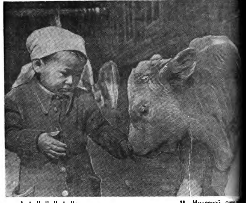
«Х А Н Н А Р»

СССР-эй ба Болгарин эршүүлэй командануудай мурысөөн шанга тэмсэлээр үнгэрөө. Түрүүшын парти СССР-эй командын илалтаар 15:11 тоотойгоор илаба. Хоёрдохи партине советскэ волейболистууд 15:10, гурбадахы партине 15:5 тоотойгоор шүүфэн байна.