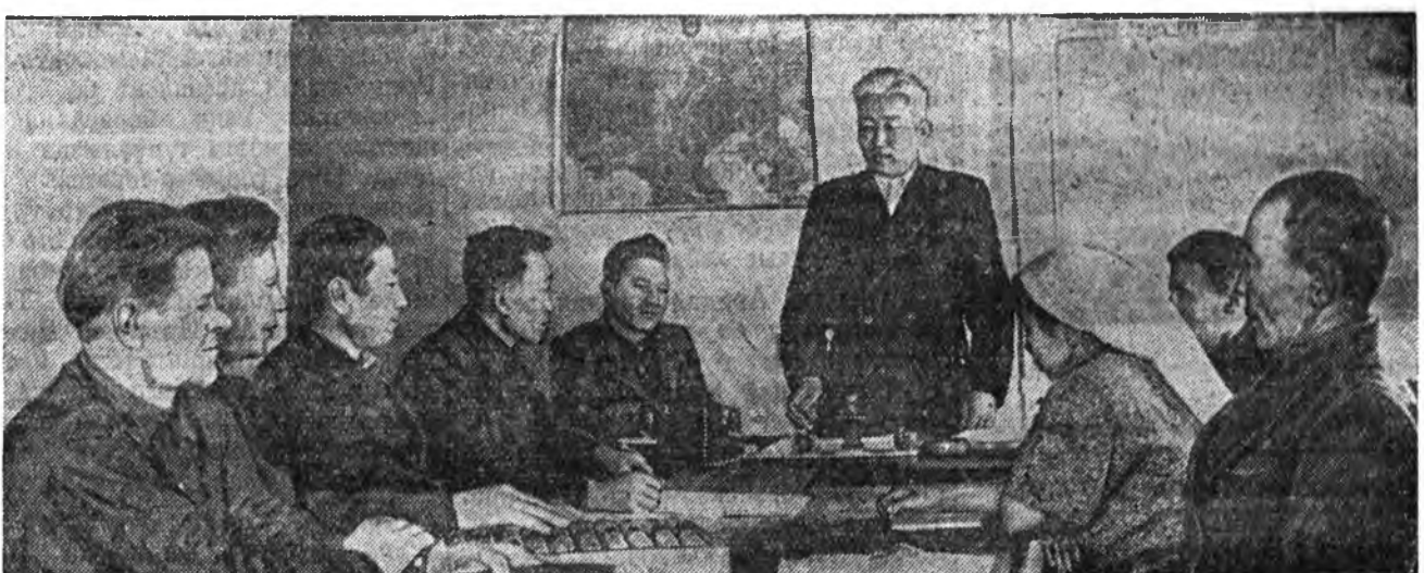
ЗУРАГ ДӨӨРӨ: правленийн түрүүлэгшэ, БМАССР-ай Верховно Советой депутат П. Э. Цыренжапов Коммунистическэ партиин XIX съездын хүдэлхэдэ абанан уялгануудай дунгуудыс колхозой элбэхтөлгэй хамта хаража байна.

Манай колхозодо зугы үсхэбэрлхэ, сад тарилга, туулай ба бусад аинуудыс үсхэбэрлхэ мэтн хамнабарини халбаринуудыс ехээр хүгжөөжэ арга боломжо бии. Гэбэ-шыс, эдэ халбаринуудай олзо до-ход хамнабарини ажахын улам бэхитэжэ манай колхозно худалдан абтаа, электрфикацияла хэзээнэ абуулганууд хараалагдана. Колхозой гэшүүд артельнэ улам арбидхалын туйлаха хайшалгалгыс ажаллана. Нийтлэ манай харууналгыс эрид хайшалгалгыс манай бүтэцтэ хүдэлмэрилхэгдэ хэзээнэ хүгжөөгдэ түсэбүүдэдэ ба үлүүлэн дүүргэжэ Жэшээнь, хонин үсхэбэрлхэ 1952 оной 100 процент, эбэртэ бодо мал хайшалгалгыс 119, шубуун — 100 дүүргэгдээн байна. Мүн малай ашаг шэмэ ижэлхэ Тэрэнэй ашаар ондоо малажалгаа 400 мянга бэшэ түхэригэй олзо абаха аргатай болоод бай-