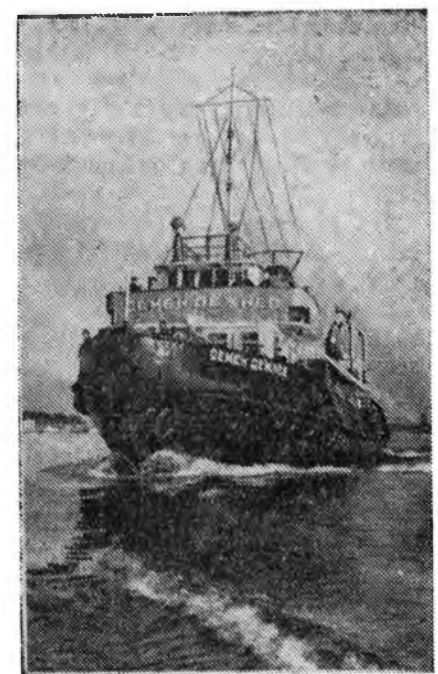
Волгодарскийн нэрэмжэтэ судоверфь- нэ (Шербакон город) «Семен Дежнев» гэжэ бусуура пароход уһанда хайхан табигдаа. Тус пароходой бүхы меха- низмүүд, жолоодо, рефрижераторная түхээрлэгнүүд электрын хүсөөр хү- дэлмэрилнэ. Энэ судна бүрин радиофи- зирвалогдонхай.