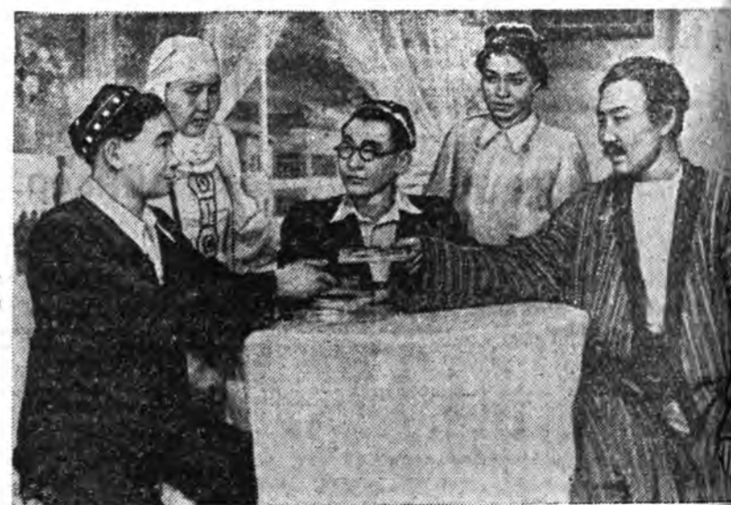
Бурят-Монголой нүүдэл театрын коллектив Агууехэ Октябрьска социалистическа революциин 35-дахы ойтой дашарамдуулан Г. Мухтаровай «Бурят ээргэ» гэжэ спектакль бэлдэбэ.

Лангош (Венгри) — Карфф (США) гэгшэдэй парти хойшоуулагдаба. Шоде де Силан (Франци) ба Грушкова-Бельска (Чехословаки) гэгшэд тэнсэбэ. (ТАСС).