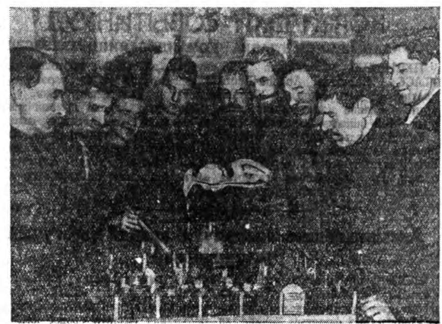
Удэ-Удэ болоһон зугышагшай республиканска зүблөнөө хабаадагшад Заиграйн аймгай «Улаан Эрхирк» колхозой пасекын мекет каража байна.