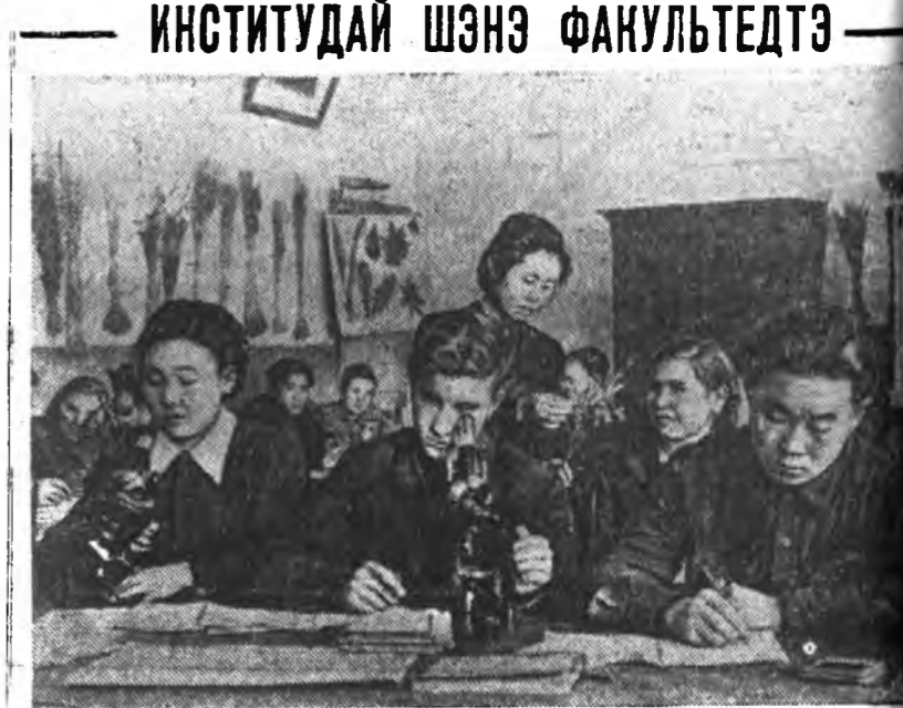
Дээдэ хургуулитай мэргэжэлтэе табаахи табанжэл соо хоёр дунд хургуулигай гажэ хараалдагхан байна. Энэ тусгай ажил хургуулигай мүнөө жэлдэ Бурят-Монголой зооветеринарна институтай гажэ агрономическа факультет шавар нэгдээ. Тус факультетта республикын аймгуудаа ерөөн 50 хүбүүд ба басагай зогта.

Депутат Владислав Дворакский гүрэнэй советые хунгаха тухай дурдахалы Лодзи городой, Краковска, Шепинскэ ба Люблинскэ воеводствонуудай депутатска бүлэгүүдэй үмэншөө оруулба.