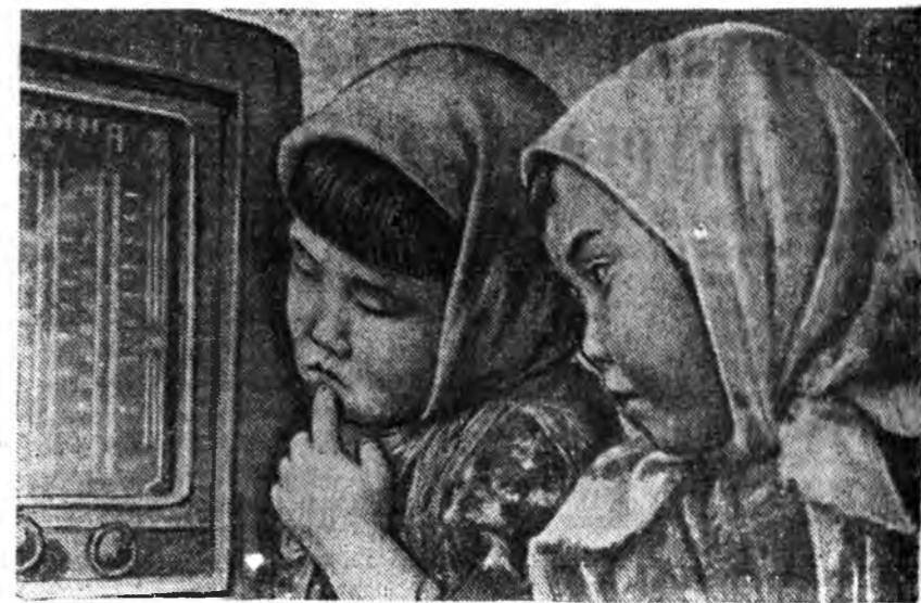
ЗУРАГ ДЭЭРЭ: Радио шагнагша үхибүүд.

★Шэнэ машинанууд абтахань. «Сельхозснаб» Бурят-Монголой конторо гараха 1953 ондо хартаабаха малтадаг машина, силосно комбайн, нарин ряттай «СУБ-48» гэжэ селжэ гэхэ мэтэ шэнэ машинануудые абахаар харална. ★Конвейер тодхогдобо. Улан-Удын пивын заводто поточной конвейер тодхогдожо, шэл соо пивэ юулжэ ба хайрсагуудтай шэл зөөжэ хүдэлмэри механизацилагдаба.