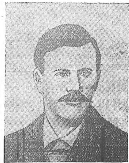
Иван Васильевич Бабушкин

(И. В. Бабушкинай түрһөөр 80 жэлэй ойдо)