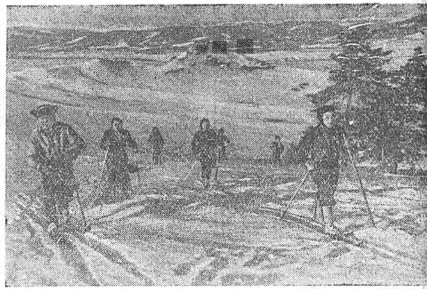
УХИБҮҮД САНААР НААДАЖА ЯВНА.

даад ябадалда гроссмейстернүүд тэнсэбэ. Тимме болохоороо, Ботвинник 2:1 тоотойгоор түрүүлжэ ябана. (ТАСС).