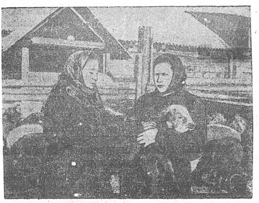
Бабонын аймаг «Коммунизм» колхозой хоншоной фермэндхитэ түл абагтын халуун саг эрбө. Мүнөө 100 гаран хонид хурьгалаа байна.