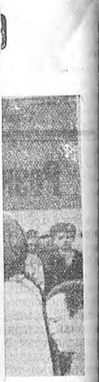
болож байна. Хэлдэг байна. Өвэй фото.