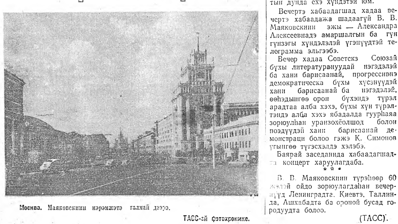
Москва. Маяковскийн нэрэмжэтэ галмай дээрэ.

Вечертэ хабаадагшад хадаа ве-чертэ хабаадажа шадаагүй В. В. Маяковскийн эжы — Александро Алксеевнае амаршалгын ба гүн гүнзэгы хүндэлэлэй үгэнүүдтэй теле-грамма эльгэбэ.