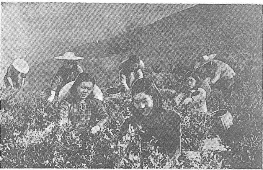
Эртэ урда сагай сайн култура хитад арадта мэдээж болохоор үни боло. Хитадай сай бүхы дэхэй дүүрэн адаршанхай. Хитадай Арадай Республикада сайн плантацинуудай талмай сэх болгодоно. Ороной өүүн талын районудта мүнөө сайн наоша сугдуулжа байна.