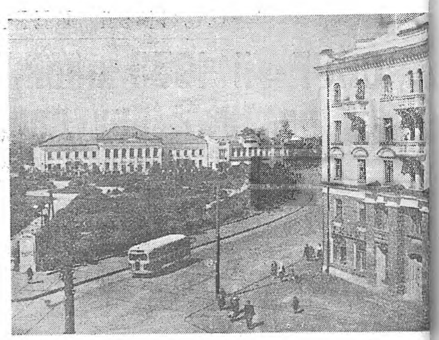
Эртэ урда сагай оройдо город Псков жэлхээ жэлдэ ургажа ба бол тухэлтэй боложо байдаг. Дайнай хойто тээхи жэлнүүдэй туршада алаһууд 200 мянга гаран дурбэлжэн метр бодохогдон ба баригдан байна.

ПЕКИН, августын 5. (ТАСС). Синьхуа агентствын корреспондент августын 4-дэ Кэсонһоо ингэжэ мэдээсэб: Корейскэ Аралай армин ба Хитадай Аралай хайндуратанай хилалта доро байгаа сэрэгэй пленейхидэй лагерьнуудта ошоһын тула Улаан Хэрээнэй холимог группа мүнөөдэр үдлөө хойшо Кэсонһоо Хойто Корей худар мөрдөбо.