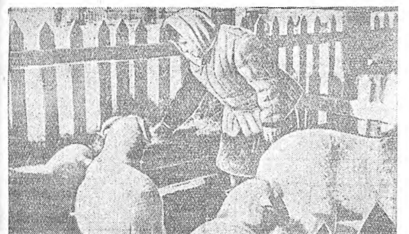
Республикын колхозуудай ажыхын гол халбаринуудай нэгэн хадаа хони үсэбэрилгэ болно. Бүүлэй жэлүүдтэ республикын түрүү колхозууд хонни бүрэгтэ ашаг ехэтэй, хүжэнги халбарн болоодын туйло горьтой хүрэмээр буулаан байна. Энэний ашаар түрүү колхозууд ба хонни-товарна фермүүд хоннино нооно хайшалагта дээшлүүлжээ, үүгээрнэй хайлааруулжа байна.