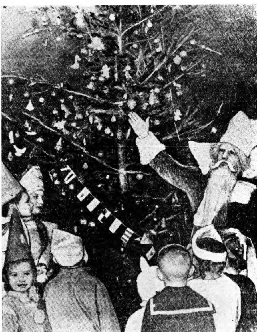
ЗУРАГ ДЭЭРЭ: Улан-Удэ городой хүтүдэй № 7 садта шэнэ жэлэй ёһоо боложо байна.

Тухайлбал, австрийска национальна банкын ямар нэгэн политическэ нүлөөнөө хамгаалуудай байхыг энэ комисси эриһэ. Энэ хадаа национальна банкын ажал-ябуудыг парламентын ба правительствын зүгһөө хинаха зарим хэдэн арга боломжотой мүнөө бэйлшын усалдаха гэһэн удхатай юм. Тухайлбал, национальна банкн генеральна советэй гэшүүдыг правительствын томилдог эрхэ халагдаха ёһотой болоно. Комиссини оруулан хэдэ хэдэн дурадхалууд хадаа Австриин национальн ажиллагадан банкыг баруунай финансова капиталтай бүрн хиналалда абаха ябадалга хүргэжэ байна.