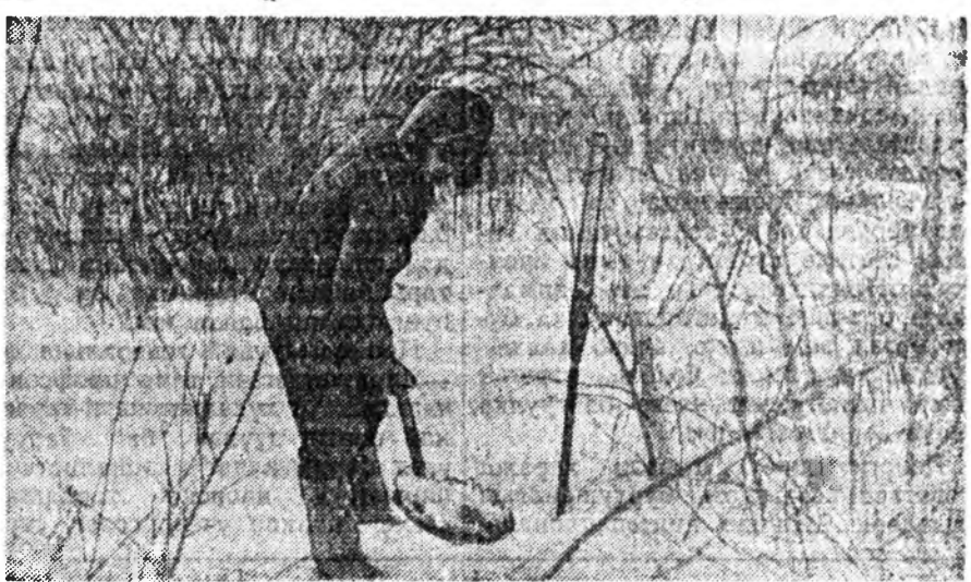
ЗУРАГ ДЭЭРЭ: луговод Бади Очирович Бадмажапов тошон халагын тула Харза гэжэ бишхэн горхойдо хаалта хэжэ байна.

Манай колхоздо 10 политой болой, 5 политой овошной, 3 политой намарай тарянай, бууса шадарай, 6 политой тэжээлэй ба 8 политой сабшалан-бэлшээрин севооборотууд бин болгодонон байгаа. Жэ-шэнь, тэжээл үйлдбэрлгэдэ гэхэ гү, малажалда хабатай севооборотуудыне абаад үзэе. 149,5 гектар дээрэ бин болгодонон фермэ шадарай севооборотой 1-дэхи полиниень 1953 ондо пар+залууг, 2-дохин полиниень пар, 3-дахин полиниень зеленко+10 га олон жэлэй ногоон, 4-дэхи ба 5-дахин полиниень зеленко, 6-дахин полиниень зеленко+пар ээллэн байгаа наа, мүнөө жэлдэ 1-дэхи ба 2-дохин полиниень шэниисэ, 3-дахин ба 4-дахин полиниень пар, 5-дахин полиниень корнеллоуд, 6-дахин полиниень хартааба+корнеллоуд +шилоснэ культуранууд ээлэхэ байна. Энэ севооборот 1959 ондо гүйсэд ашаглалгада орохо ёһотой юм. Тэрэшилэн 700 гектар дээрэ 1953 ондо бин болгодонон тэжээлэй севооборотой бүхы 6 полинуудыне гол түлбэ шэниисэ, зеленко, хара тарлан, пар гэхэ мэтэниүүд ээллэн байгаа. Тинхэдэ мүн лэ нёдондо 160 гектар дээрэ бин болгодонон 8 политой сабшалан-бэлшээрин севооборотто тэрэ жэлдэ юушье хэрдэггүй, газар элүүр заандаа орхингодо. Имагтал мүнөө жэлдэ 1-дэхи полини, хойто жэлэнь 4-дэхи, 5-дахин ба 6-дахин полинуудынь пар болгодоно юм. Энэ севооборотто олон жэлэй ногоонууд хэлы жэл үйлдбэрлэн хойно таригдажа эхилэхэ байна.