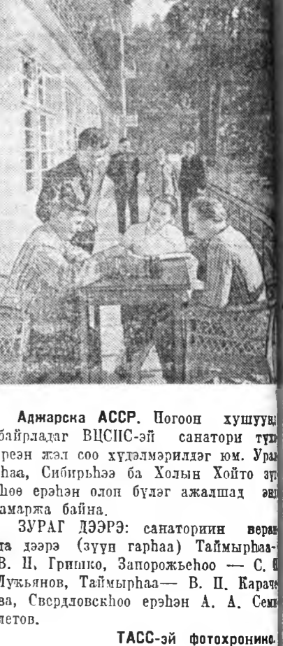
Адмарсна АССР. Погоч хушууд байрладаг ВЦСПС-эй санатори түрэн жэл соо хүтэмэрлэг юм. Урлаа, Сибирьһээ ба Холы Хойто эрлөө өрлөн олон бүдэг ажалшад адмаржа байна.

Арбан хоёрдохы туртай һүүлэ Корчой түүрүүлжэ ябана. Тэрэ 8 очкотой ба нэгэ хойшоуулагдан партигай. Авербах 8 очкотой ба нэгэ хойшоуулагдан партигай. Январин 26-да, 13-дахы тур болохо.