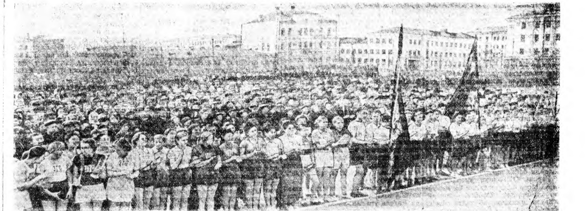
Майн 9-нэй үдэр. Эртэ үглөөнөө спортсина хубсаһа үмдэһэн олон тоото залуушуул Улан-Удэ городой үйлсэнүүдээр нэгэ зүг барин шэглэнэ.

Улсын урагшаа «Бурят-Монгол үнэн» газетын редакцины байшан хүртэр, тэндэхэн гэдэргээ КПСС-ий обкомой байшан хүрөөд, дахяад Советүүдэй Байшан хүртэр байба.