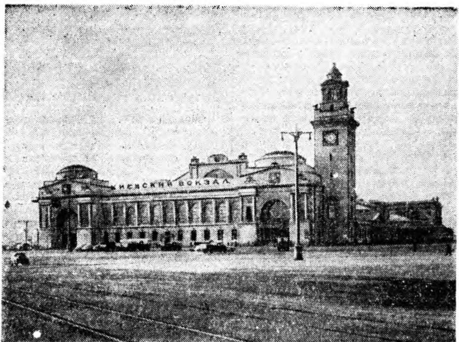
Росситай Украиннын нэгэдэһээр 300 жэлэй ойн дурсаһалда Москва городой Киевскэ вокзалай талмай дээрэ монумент табижа гэжэ ССР Союзай Министруудай Совет тогтообо.

Коммунистуудай дааж байһан устасгуудайн түлөө харюусалгыне дээшлүүлхэ гэһэн — партинын организацинуудай тон шухала уялга мүн.