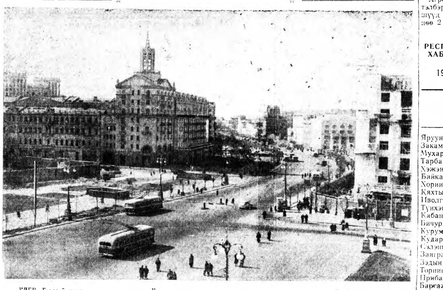
КИЕВ. Городой центральна магистраль — Крещатик. ТАСС-эй фотохромино.

Казань. Татарини городууд болон тохонуудта украинска арадай үнгэрһэн түүхэ, өөрыгөө сүлөөтэй ба бэсэ даанхай байхын түлөө тэрэ- нэй гэмсэлтэ советскэ Украинин һалбаран хүгжэлтэс харуулаһан ли- тературануудай, фотографинуудай ба материалнуудай выставкэнүүд нэгдэ. Алдарты үдэртэ зориулагда- һан сэхэ выставка В. И. Ульяновой (Ленинэй) нэрэмжэтэ Казаньска уни- верситетдэ эмхидхэгдэ. Росситай Украины нэгэдэнээр 300 жэлэй ой тухай хөөрөлдөөнуудыс республикын олон мянгаад агитатор- нууд татарска, ород, чувашска, мар- ийска, мордовско ба удмуртска хэл- лэнүүд дээрэ эдэ үдэрүүдтэ үнгэр- гэнэ. Алдарты үдэртэ зориулагдаһан кинофестиваль Казаньин Культурын ордонууд болон клубуудта эхилэ.