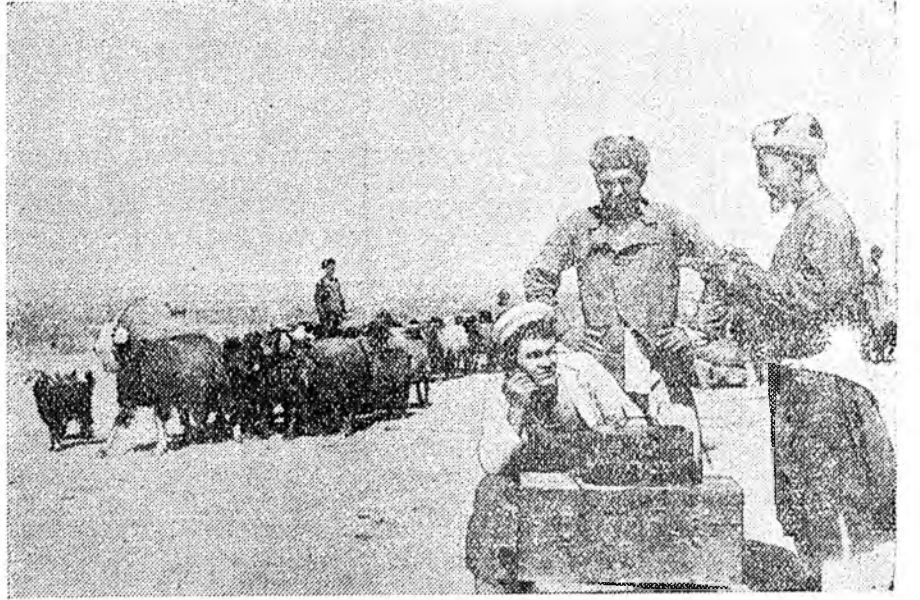
Узбекскэ ССР. Каракулева хони үсхэбэригые хүгжөөлгөөр амжалтануудые туйлаһан «Фабрик» совхозо хүдөө ажыхын Бүхэсоюзна выставкын кандидат болгондо. Мүнөө хонидын зунай бэлээрда гаргагдаба. Отарануудые ветеринари врачүүд ба зоотехнигүүд харалсан абана. Хонидо һүдөө радиостанцигай юм.

И. ШУТИКОВ, Дубоссарска ГЭС-эй барилгын начальник.