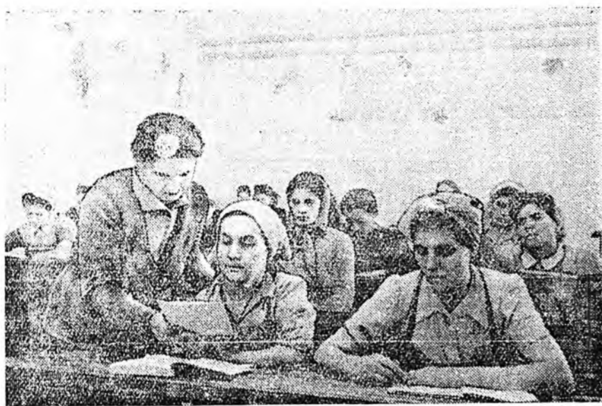
Румыни. Хаанта засагтай үед Румынгийн ажлынханд ном бэлэгтэ хүрэлсэхэд аргагүй байсан юм. Мунөө үед Ардад республикийн гэрэлтэн бүхэн хүрэлсэхэд аргагүй дүүрэн элдэнэ. ЗУРАГ ДЭЭРЭ: бухарестын эрэлтийн фабрикада эхнхдэгдөн ехэ набатынай хурууныин занги боложо байна.