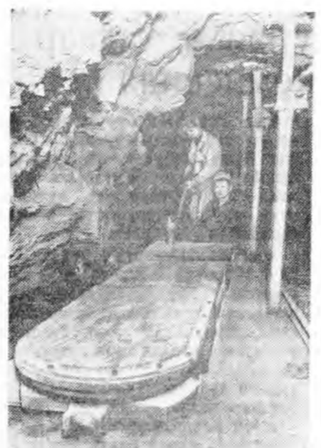
Эстонска ССР. № 2 шахта станция бисейи соо эрхмүүдэй нэгэн юм.

вой байра бариха захалаа. Энэ хүдэлмэригдэмнэй нилээд олон бэрхшээлүүд ушарна.