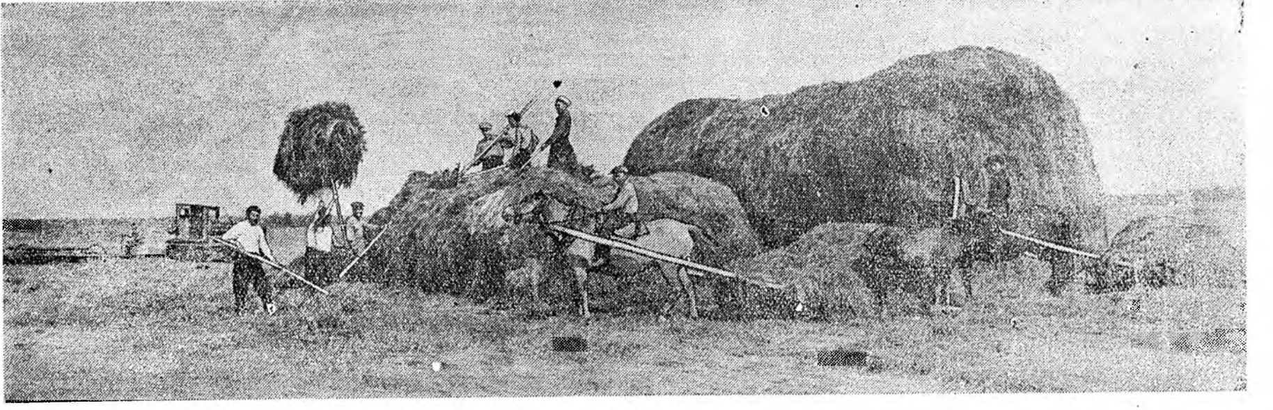
ЭМРАГ ДЭЭРЭ: Байкало-Кударин аймагай Воюулоһоний нэрэмжэтэ колхозо үбнэ бүрилгэлэ.