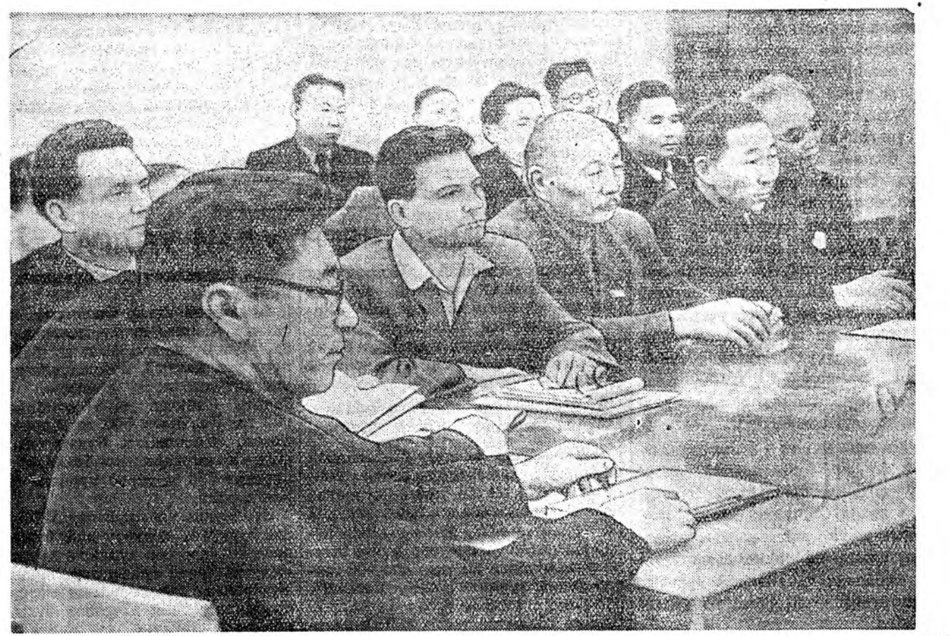
ЗУРАГ ДЭЭРЭ: республикын уранзохёолшодой II съездын президиум.

Манай республикын уранзохёолшод помүүдые үсөөһөөр ба муугаар бэшэнэ. Тэдэнэр мүнөө үеһн байһал шухала теманүүдтэ бэшэ ёһотой. Мүнөө үеһн удха түгэлдэ уранһайханай талаар бүрин гүйсэ зохёолнууды бэшэхэ гэжэ манай ушаршад эрнэ.