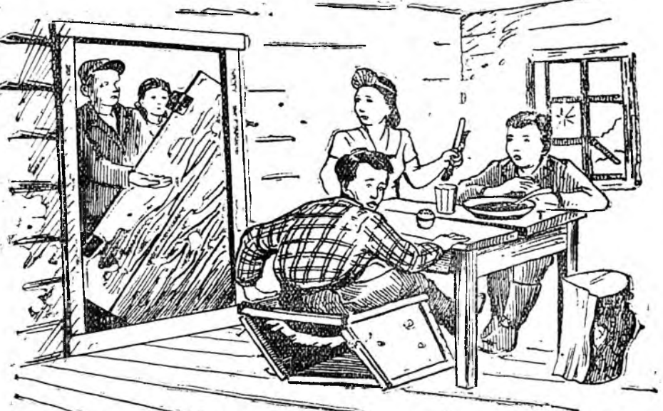
Орохые хүсгыз: — хаагуурнь, хайшан гээд ородог иш? Официант: — дээгүүрн харайгад гү, али доогуурн тулдиррад орогты саа-ша!