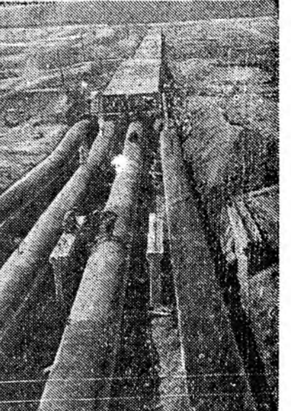
Азербайджанскэ ССР. Самур-Динчи-нскэ канал хобдорхи элэжэнэй барилга үргөөр дээрнхэй. Шэнэ улан магистраль 84 километр татагдаха юм. Барилганд хүсэтэ шэнэ техника хэрэглэн, унахай хаалтанууды болон гидротехническа бусад барилганууды хэжэ байна.

Советскэ Правительствона делегацие толгойлошо нүхэр Н. С. Хрушев аэродром дээрэ ингэжэ үгэ хэлээ: