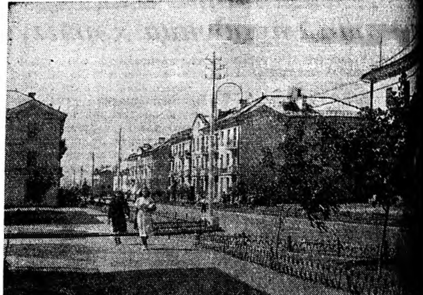
Саратов улам бүри гоё һайхан болгогдожо байна. Социально-культурной байрын гэр байшануудые барилгада гансал нёдондо жээдэ 125,4 мянган рубль гүрэн табигһан байна. 1954 ондо энэ зорилгоор үшөө ехэ мүнгэн гаргашан юм. Энэ жээдэ 100 мянган квадратна метр талмайтай байрын гэрнүүд ашиглада оруулагдаха байна. ЗУРАГ ДЭЭРЭ: Саратов городой Ленинскэ районной хүдэлмэришадэй үйлсэнуудэй нэгэн.

Арадай хэрэглэлэй эд бараа үйлдбэрлгы ехэ болгохо, тэдэнэй шанарые найжаруулха ба ассортиментьен үргэдэхэ хэрэгтэ онсо анхарал хандуулагдаа.