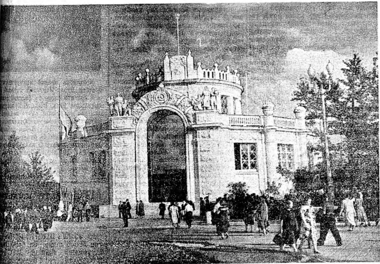
БҮРЯТ ДЭЭРЭ: «Хартаба ба овоц» гэжэ павильон галгана харуулагдана. Эндэ 31 колхозой, 10 совхозой,