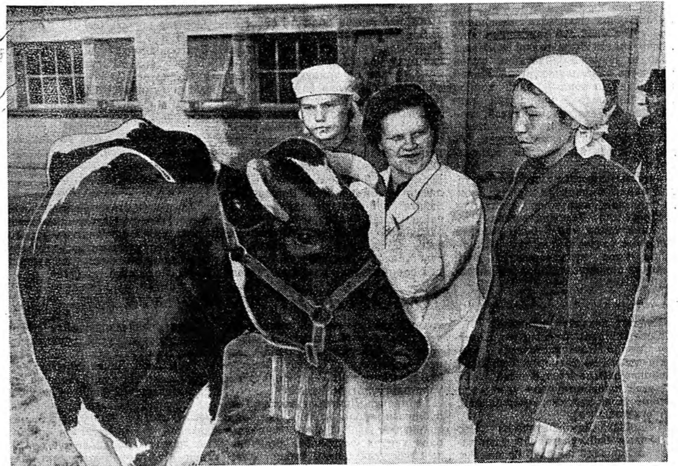
Холмогорско үүлтэрэй мал найжаруулжа хүдэлмэри хэдэг Архангельска областин Холмогорско районной «Новая жизнь» колхозой племенной фермын туйлалтанууд выставкэдэ үргэнөөр харуулагдаа. Тус фермэ недондо үнээн бүриһөө дунда зэргээр 3,34 процент тоһолготой 4615 килограмм хү наагаа.

Советск Союзай хүдөө ажыхын хурдан түргэнөөр хүгжэнэ байһыг выставкэ эли тодоор гэршэлнэ. Бидэнэр Российска Федерациин павильон соо ороно, хүдөө ажыхын үйлдэбрийн амжалтыг хараабди. Советск Союзай эгзэн томо республина болгошо Российска Федерациин хүдөө ажыхын бүхэ халбарин амжалта энэ павильон соо эли тодоор харуулагданхай. Эзэнтэй хамта энэ республина дотор ажалууна байн олон яһатанай ажыхын ба культурна хүгжилтэ харагдана. Хүдөө ажыхын выставкэ дээрэ харан, үзэн юмэнүүдэ нотагаа бусажа, нүхэдтөө хөөржэ үгэхэбди. Монголой бүдэг студентнэр.