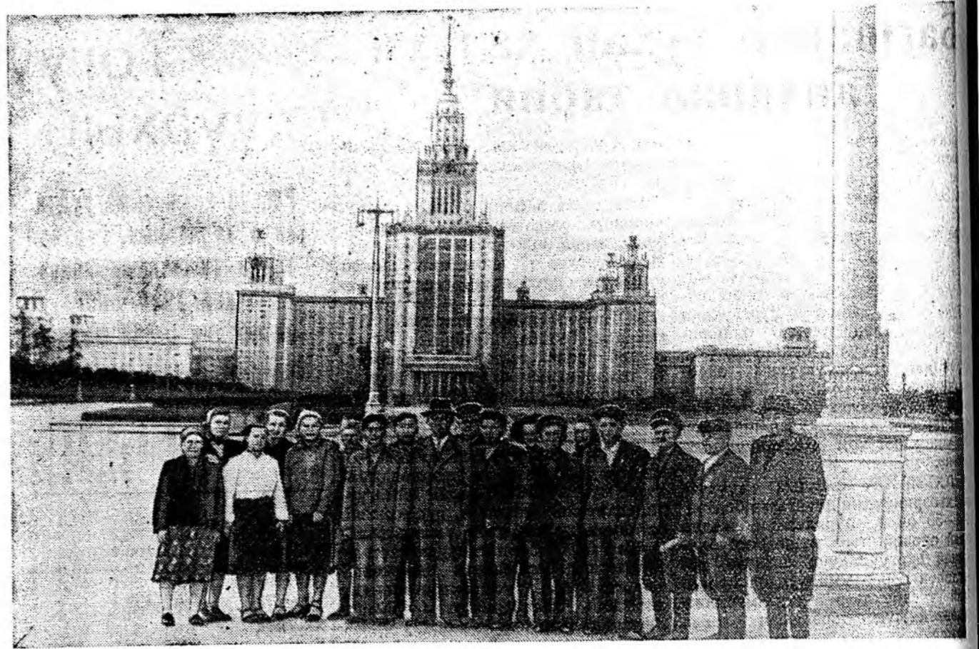
ЗУРАГ ДЭЭРЭ: Бурят-Монголоо выставкэдэ хабаадагшад ба экскурсантнууд Ленинскэ хадануудтай М. В. Ломоносовой нэрэмжэтэ гүрэнэй ушверситетэй дэргэдэ байна.

ВСКВ-дэ энэ хизаарай зал соо Рубцовскэ район—алтайска үүлэрэй нарин ноһотой хонидой нэгэ ехээн база харуулагдаа. 1953 ондо эндэ хонин бүриһөө дунда зэргээр 5,3 килограмм ноһон хайшаалагдаа, 100 эхэ хонин бүриһөө 113 хурьян абтаа. Нүүлэй табан жэл соо колхозууд болон совхозуудта энэ район алтайска үүлэрэй 27442 племенной хонидыс худалдаа.