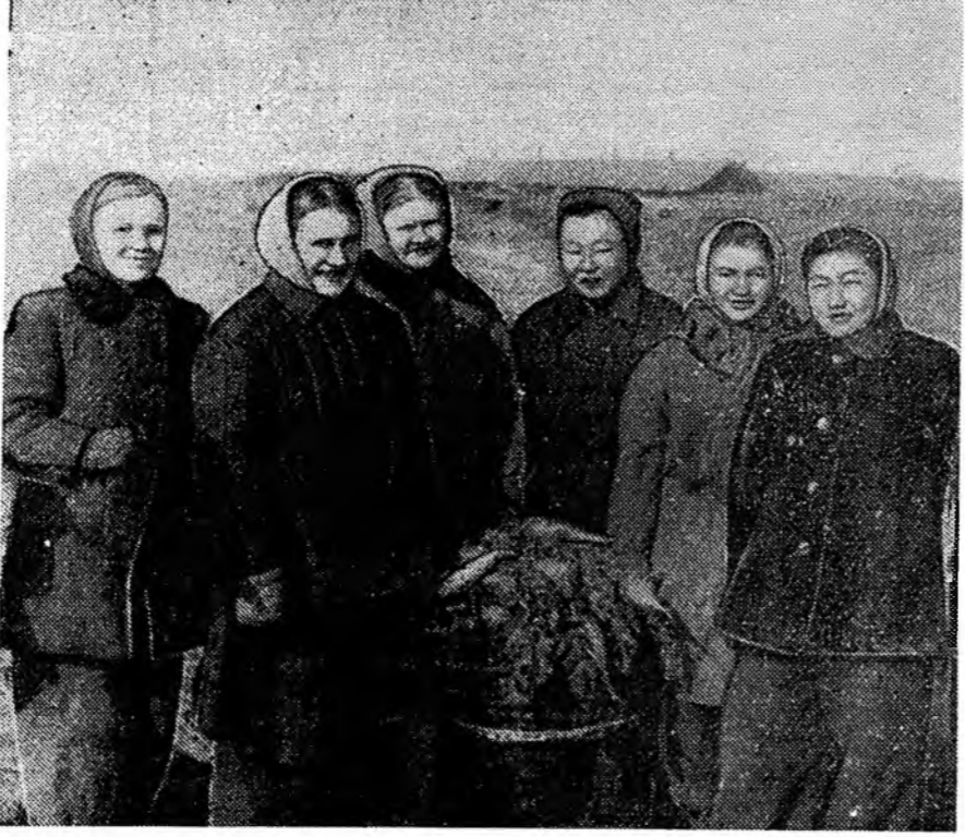
Улан-Удын дүрбэдхи хургуулийн 8-дахи классай хурагшад Байкало-Кударын аймагай Лениний нэрэмжэтэ-колхозой овошье хураалгада ехэ туһаламжа хүргэбэ.