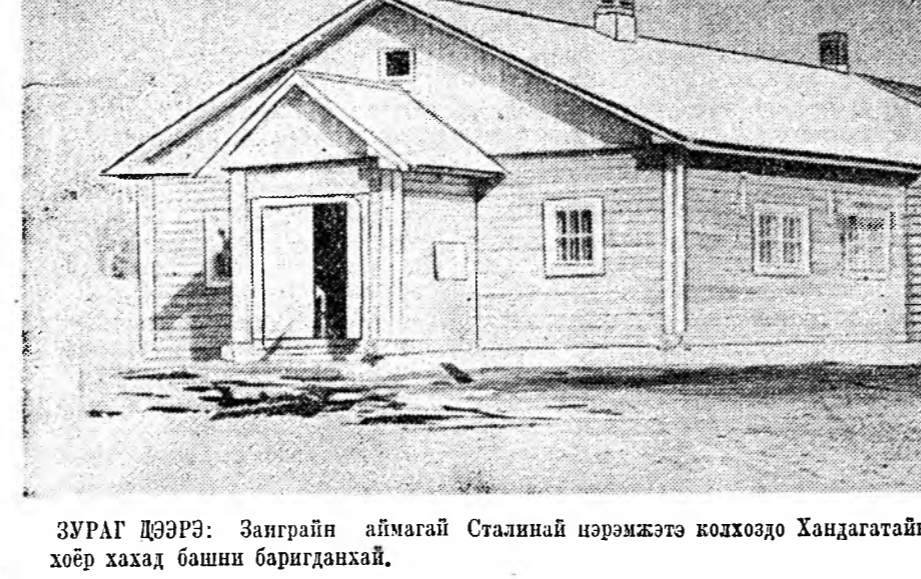
ЗУРАГ ДЭЭРЭ: Заиграйн аймагай Сталиной нэрэмжэтэ колхозодо Хандагатай деспримхозой барига үгэһэн 100 үхэрэй байха шээ байра. Эндэнь мүн силостэ хоёр хахад башни баригданхай.