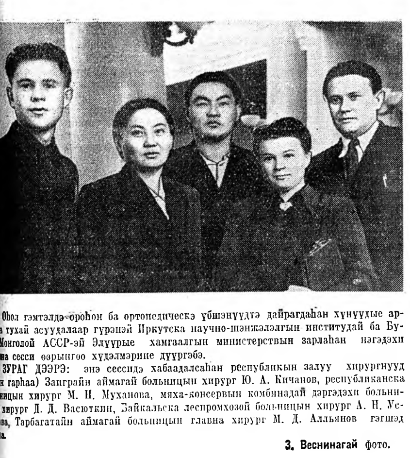
3. Веснинагай фото.