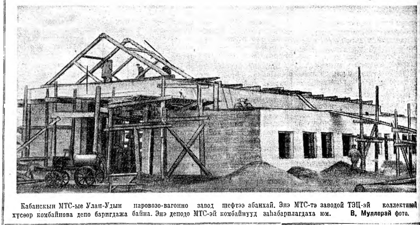
Кабанскын МТС-ые Улан-Удын паровозо-вагонно завод шөфтэе абанхай. Энэ МТС-та заводой ТЭЦ-эй коллективэй хүсөөр комбайнова депо баригдажа байна. Энэ деподо МТС-эй комбайнууд заһабарлагдажа юм.

Тэрэ байшангай доодо дабхарын мяханай комбинадай цех шэнги юм. Тэндэ котлетэ, сосиска, мяхатай пирожки,пельмень хэдэг автоматууд табигдаһанай.