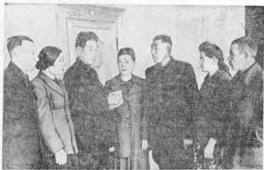
ЗУРАГУУД ДЭЭРЭ: республиканска зүблөөндэ хабаадагшад заседанин зааһарта хооралжэ байна.

Малайһаа үүлтэр найжаруулы хэрэгтэмэй республикын Хүдөө ажахын министрство һулаар туйлаһа. Һүүдэй жэлнүүдтэ манай Курумканай аймагай племенной һайн бундууд гэгдэгдэхэе боллино. Тиндэ, племенной хусанууд ямаршые түсэбгүйгөөр эльгэгдэнэ. Тэрэ саам манай колхоздо эльгэгдэһэн хусанууд дандаа хоёрдохи классайнгуа. Эдэ бүгэдэһөө боложо биднээр племенной хүдэлмэри ябуулха аргандэһэбди.