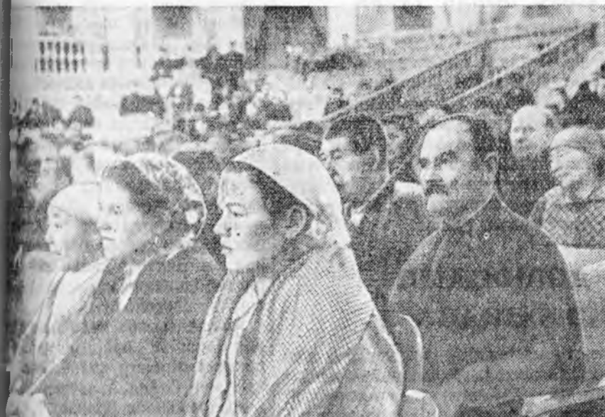
Малшадай республиканска зүблөнэй заседанин зал соо.