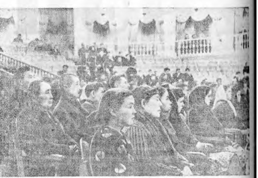
Малажалай республиканска зүблөөнэй заседанин зал соо.

Улаань нүхэр Лесик энэ жэлэй малай үбэлжэлгые амжалтатайгаар үнгэрэхын тулада бүхы хүсэ шадалаа элсүүлхыен зүблөөндэ хабаадагшадые, тэднээр дамжуулан бүхы колхознигуудые халуунаар уриалба.